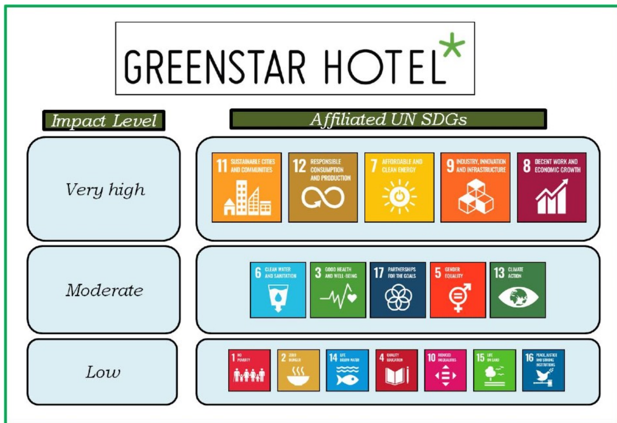
Kuva 3: GreenStar ja YK:n kestävän kehityksen klusteritavoitteet, jotka perustuvat sisäisesti tunnistettuihin vaikutustasoihin.

GreenStar ESG -strategian puitteissa vedämme myös yhteyden YK:n erittäin oleellisiin kestävän kehityksen tavoitteisiin (UN SDG). Useilla 17:stä SDG:stä on suuri merkitys toiminnallemme, ja hahmottelemme perustelut seuraavassa. Kokoamme kaikki 17 kestävän kehityksen tavoitetta kolmeen kategoriaan kuvataksemme mahdollisuuksiamme ja velvollisuuksiamme edistää parannuksia kaikkien ESG-ulottuvuuksien ja Yhdistyneiden Kansakuntien ympärillä olevien kansainvälisten yhteisöjen pyrkimyksissä.